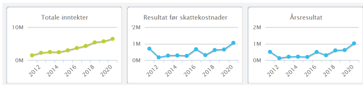
Figur 1. Totale inntekter, resultat før skatt og årsresultat for Herbo AS i perioden 2012-2020.

Herbo har hatt økende driftsresultat over år. Sluttresultatet for 2020 var på litt over 1 million kroner, med tilhørende driftsinntekter på litt over 6 millioner kroner. Vedlikeholdskostnadene på boligmassen er årlig på ca. 1 million kroner. Selskapet har store lånekostnader, ca. 64 millioner kroner. Dette kan det knyttes risiko til. Alle lån, bortsett fra de i Husbanken, er flyttet til Kommunalbanken for å få bedre vilkår. Selskapet har bygd opp et overskuddsfond som gir trygghet for påløpte lånekostnader. Fondet var i regnskapet for 2020 beregnet til 4,9 millioner kroner. Det var pr. desember 2020 100 prosent utleie av Herbos boliger, med 7 kandidater på venteliste.